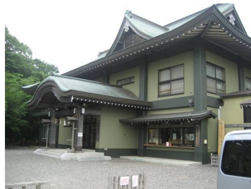
(患者サービス向上委員会)